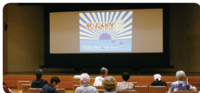
高齢者福祉部「想い出映画館」