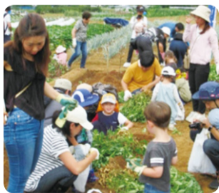
女性幼児福祉部 「親子でさつまいも・落花生堀り」