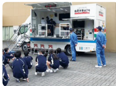
青少年福祉委員会「防災教室」