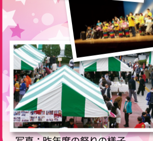
写真: 昨年度の祭りの様子

皆様お誘い合わせの上お越し下さい。詳細については随時ホームページや次号広報紙等でお知らせいたします♪