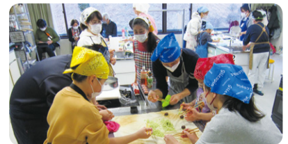
青少年福祉委員会「親子の食育講習会」