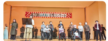
障がい児福祉委員会「ふれあい合唱コンサート」