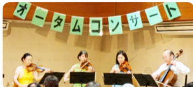
障害者児福祉部「オータムコンサート」