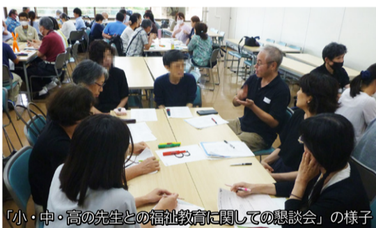
「小・中・高の先生との福祉教育に関する懇談会」の様子

麻生区社協では福祉教育推進のため、麻生区内の福祉施設、障害のある方などの当事者団体、福祉活動に携わるボランティアグループ等にご協力いただき、地域全体で福祉教育に取り組めるネットワークづくりや、地域内の社会資源と福祉教育を結びつけるためのコーディネートをしています。