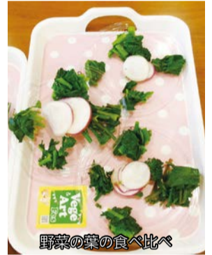
野菜の葉の食べ比べ

参加者からは「多くの学びがありました。」「若い時期からバランスの良い食事を摂ることの大切さを若い人にどんどん伝えたい。」「大学生が作ってくれたすばらしいゲームに楽しさを子どもたちと共有できたことは大変良い経験をさせていただきました。」などの感想をいただきました。