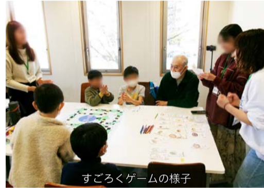
すごろくゲームの様子

2日目は、実際にふらっと新百合ヶ丘に行き、活動の体験を行いました。まずは大学生が考案した郷土料理のカードを集めるすごろくゲームに参加しました。都道府県のマスに止まると、その場所の郷土料理や特産品が描かれたカードをもらうことができ、地域の特色について学ぶことが出来ました。次に、地元の農家さんからご提供いただいた野菜(のらぼう菜、あやめ雪かぶ、ほうれん草、大根)の葉の食べ比べを行い、どの野菜の葉なのかをグループで話し合い、最後に発表を行いました。全種類正解のグループもあり、大変盛り上がりました。